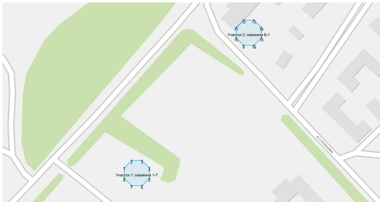
СХЕМА РАСПОЛОЖЕНИЯ УЧАСТКА НЕДР И ОПИСАНИЕ ЕГО ПРОСТРАНСТВЕННЫХ ГРАНИЦ

Пространственные границы и статус участка недр: